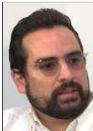
Alfonso Durazo Chávez