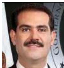
Guillermo Padrés Elías